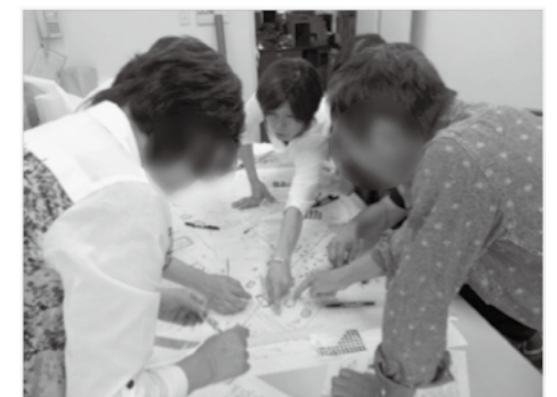
模擬マップづくりの風景です