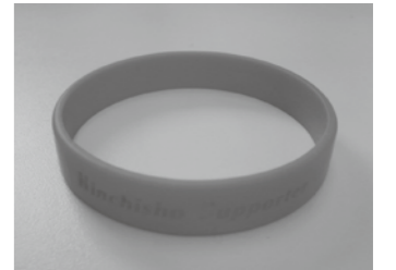
受講された方には認知症サポーターのオレンジリングを差し上げます。