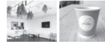
カフェチケット 【harito(はりと)：提供】