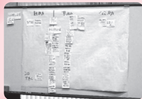
「自助」、「共助」、「公助」と分けて考えていくと、「共助(地域住民同士で助け合う)」の視点で、もしかしたら解決できそうかも...!という項目がたくさん出てきました。

今回の地域づくり塾では、人口減少社会で起きることを確認し、話し合いをより進めやすくする方法など、講師の指導を通して体験しました。