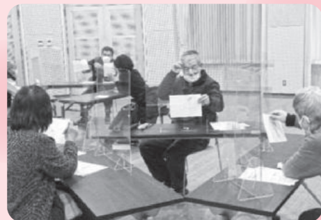
まずは文字に書く!こうすると意見が出やすくなりました。

*各自治体と各地域の創意工夫による地域づくりを通じて、豊かで多様なつながりのある地域づくりを目指すものです。(播磨町委託事業)