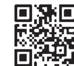
播磨町社会福祉協議会

詳しくは、播磨町社会福祉協議会・兵庫県社会福祉協議会のホームページをご覧ください。