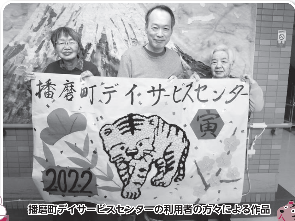
播磨町デイサービスセンターの利用者の方々による作品