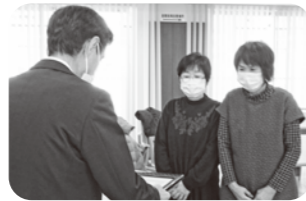
ゆうあい園保護者会