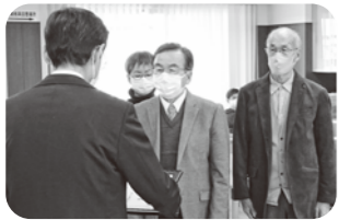
播磨町手をつなぐ育成会