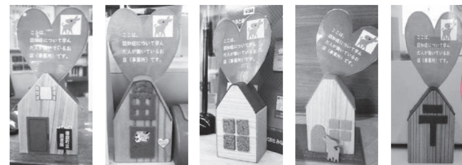
播磨町立図書館 西条堂 みなと銀行本荘支店 あえの里式番館 本荘郵便局

認知症の方やその家族を応援する事業所(お店)が広がっているということや、物忘れがあっても安心して立ち寄れる事業所(お店)ということをわかりやすく示すため、窓口や、玄関扉に認知症サポート店の目印設置を勧めています！