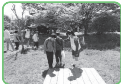
ガイドヘルプ体験