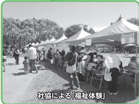
社協による「福祉体験」