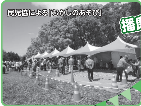
民児協による「むかしのあそび」

播磨町ボランティアセンター・播磨町善意銀行 発行所：社会福祉法人 播磨町社会福祉協議会 TEL079(435)1712