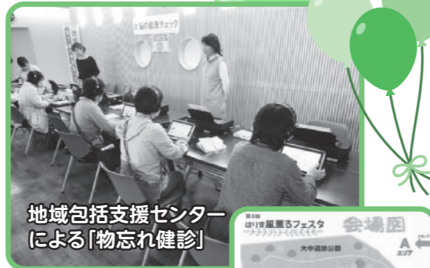
地域包括支援センター による「物忘れ健診」