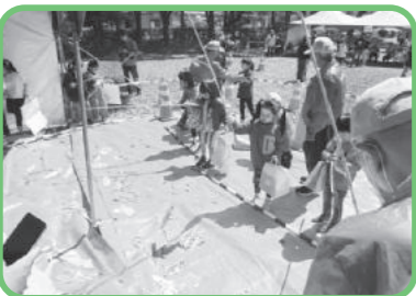
むかしのあそび ～魚釣り～