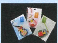
(福ろうストラップ)