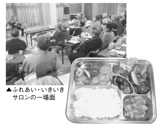
▲ふれあい・いきいきサロンの一場面